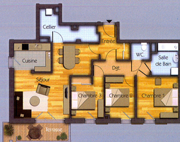
1 exemple d'appartement T4

■ La maîtrise d'énergie. La conception des bâtiments s'oriente vers une maîtrise de la consommation d'énergie, notamment grâce à une nouvelle technologie telle que la mise en place d'une VMC double flux permettant de réchauffer le logement plus écologiquement, en réduisant les différences de température entre l'intérieur et l'extérieur.